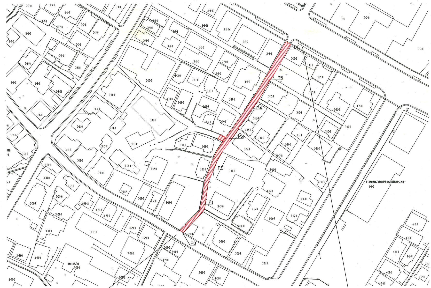
路面復旧工事 市道・私道 歩車道 AS t=5cm A=305m 2