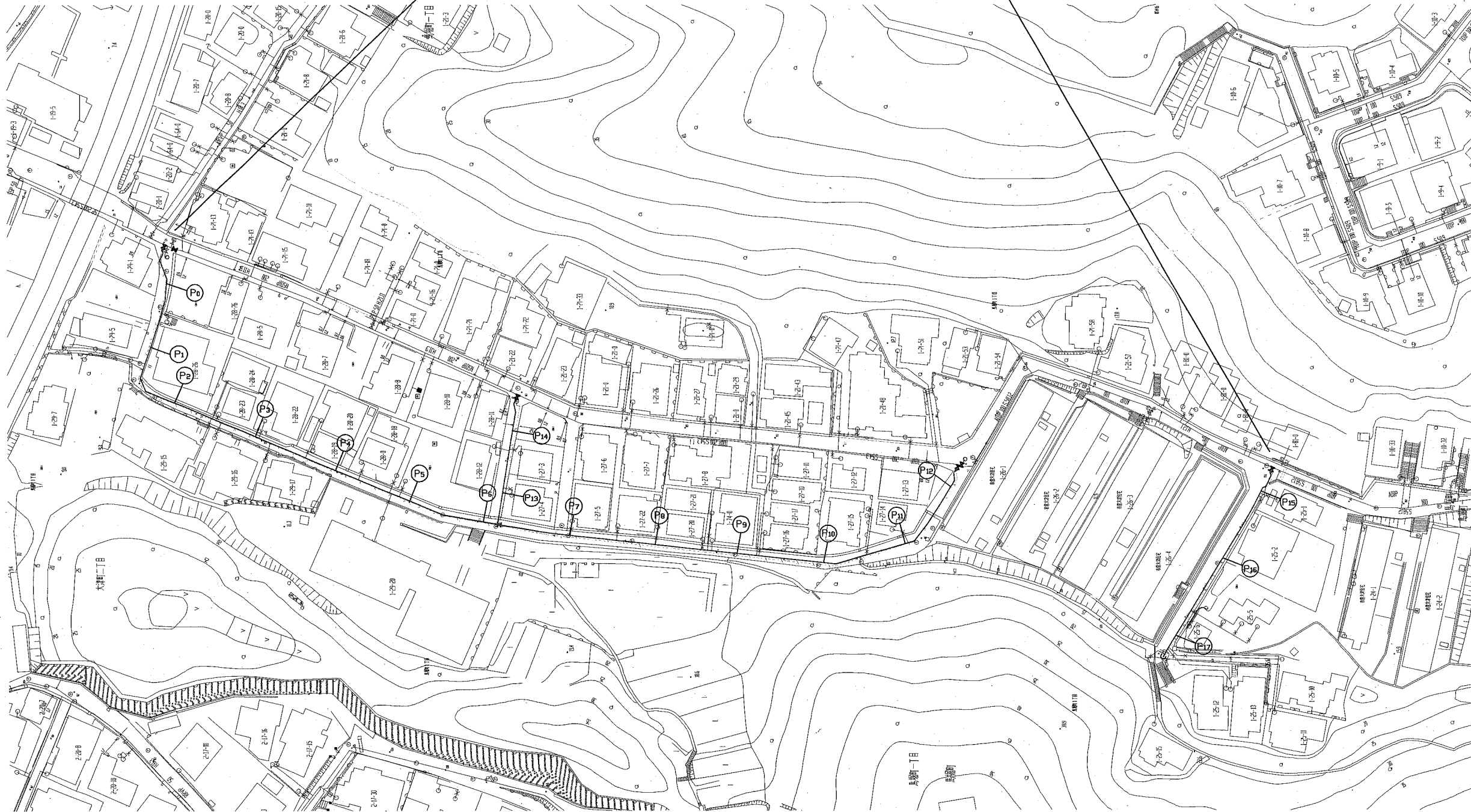
工事区間別内訳明細表