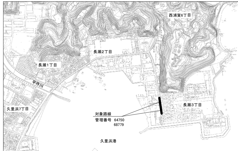
平面図(2) 久里浜第1地区(長瀬3丁目)