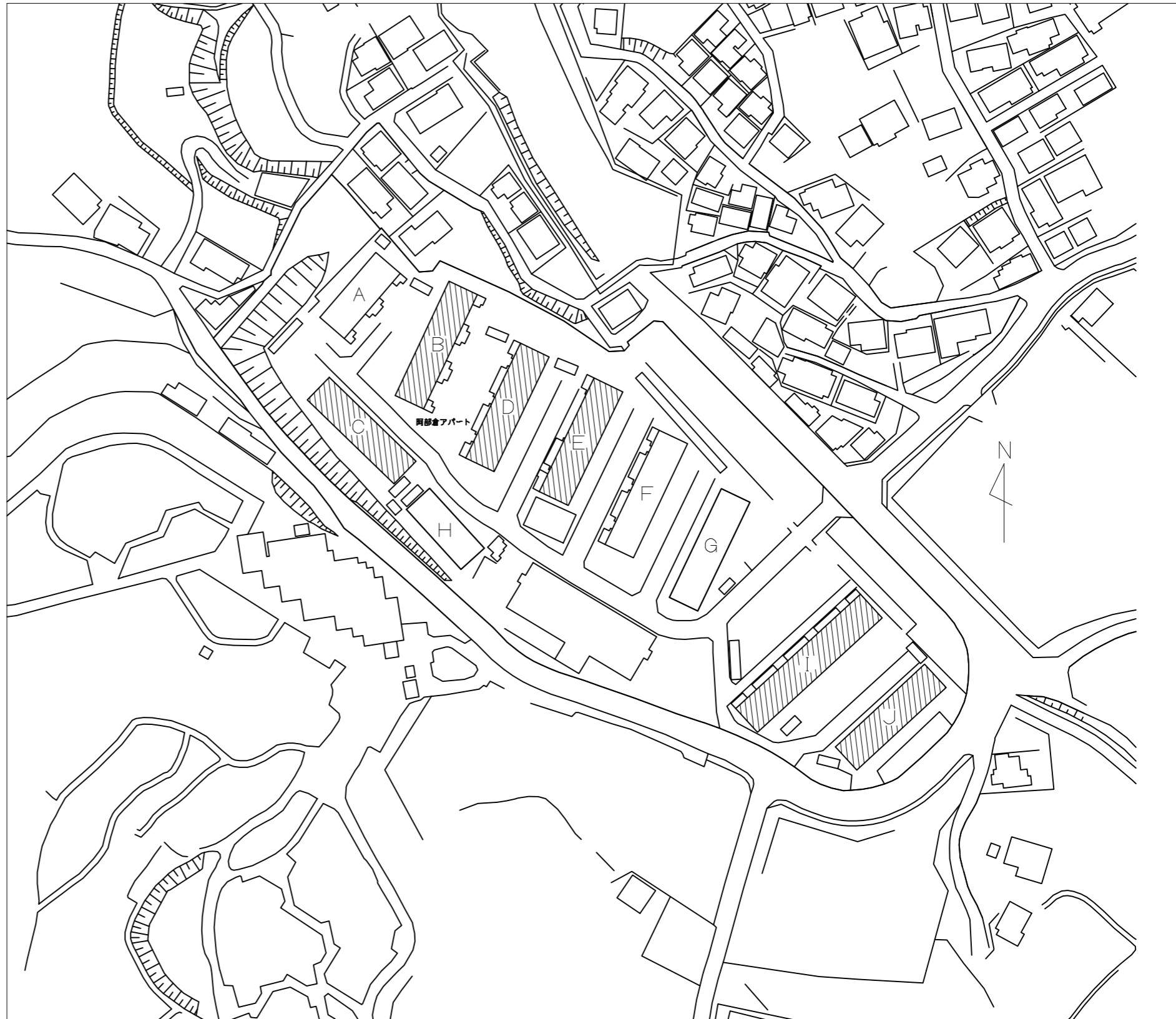
阿部倉アパート配置図 1/1000