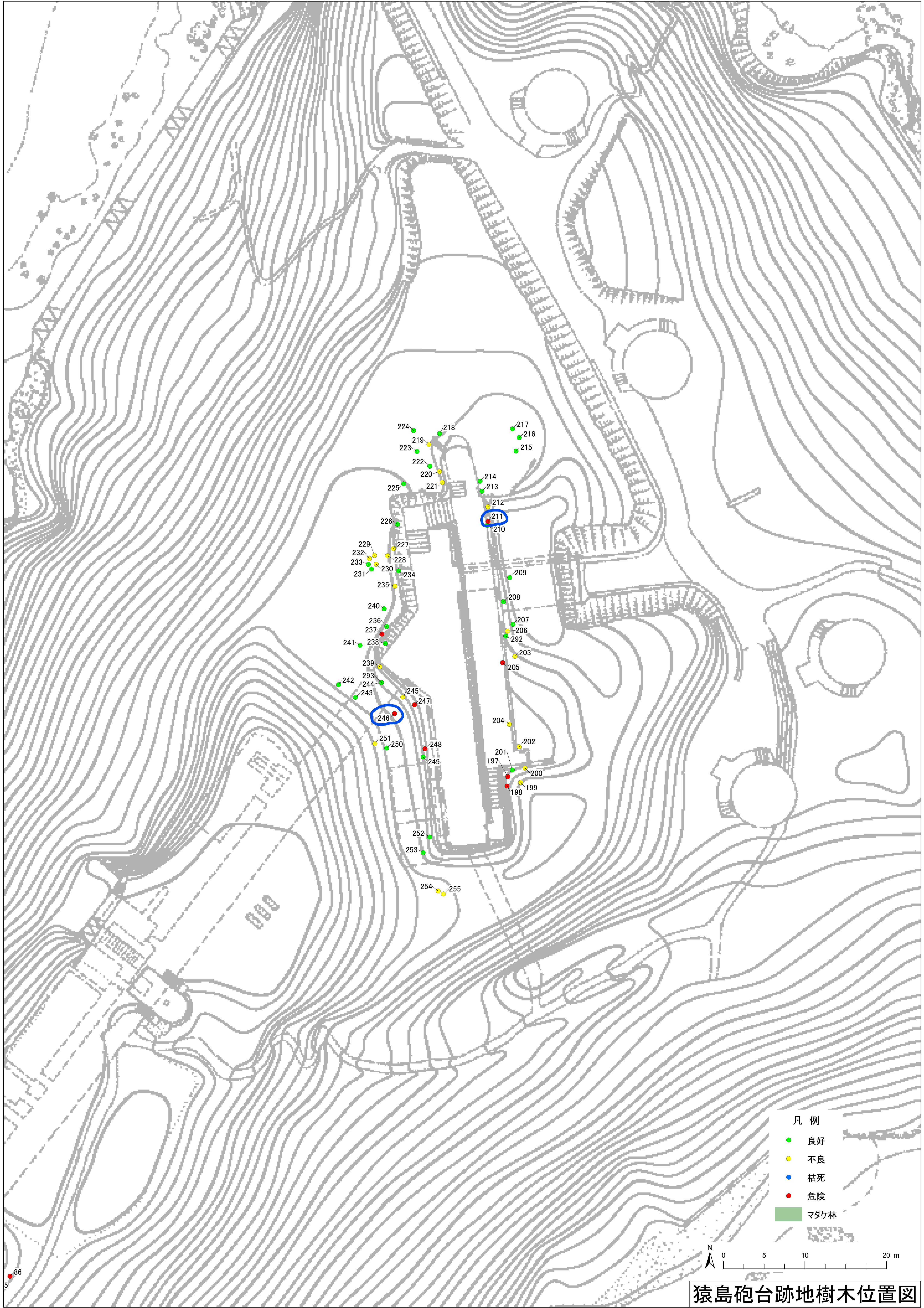
猿島砲台跡地樹木位置図