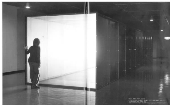
(別紙3 倉重作品画像④参照)