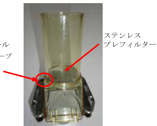
写真1 フィルターホルダー