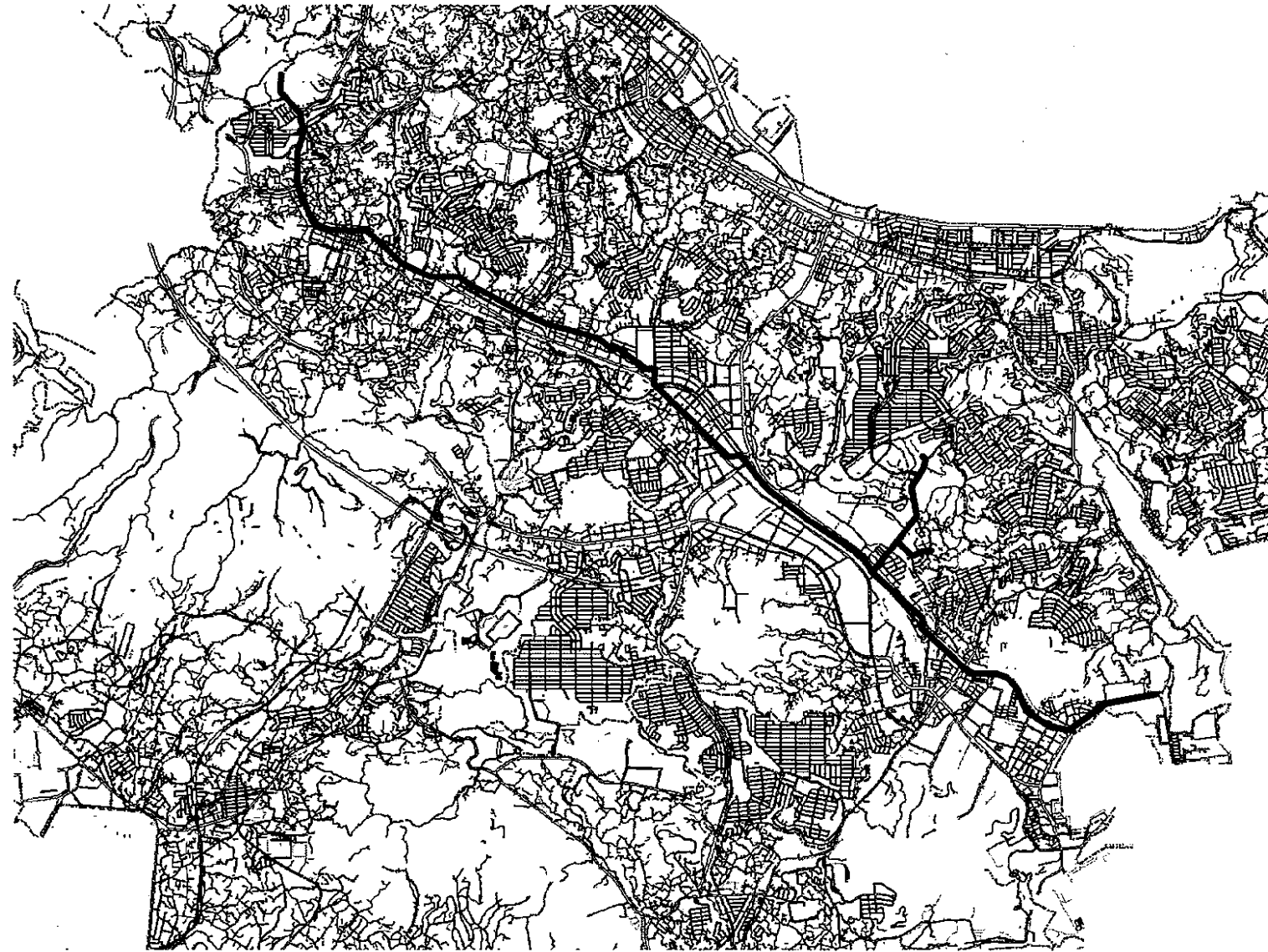
3100 中央幹線本管(1) 12.13km 弁栓 + 路面