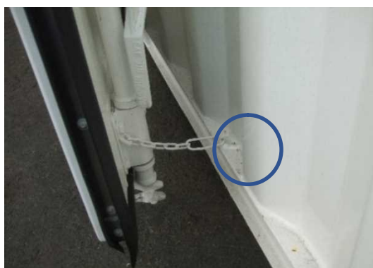
留め金用のL型フック（長辺左右）