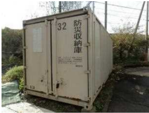
① 大津中学校・スチール製・No. 3 2