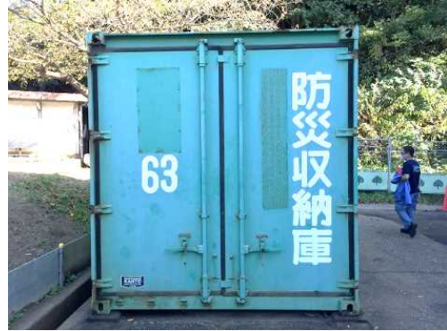
② 鴨居中学校・スチール製・No. 6 3