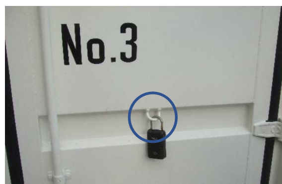
鍵ボックス用のU型フック（扉の左右） 本体の各短辺中央部分にも設置 合計4か所（鍵ボックスは当課で準備）