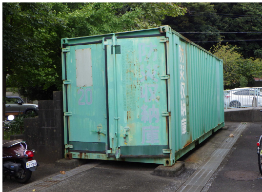
③ 馬堀小学校・スチール製・No. 2 0