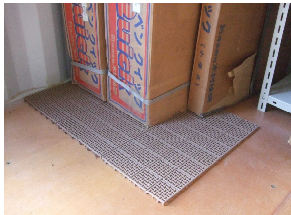
ジョイント式プラスチック製の このこ (30 cm×30 cm) 20枚