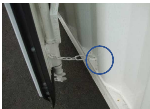
留め金用のL型フック（左右各1か所）