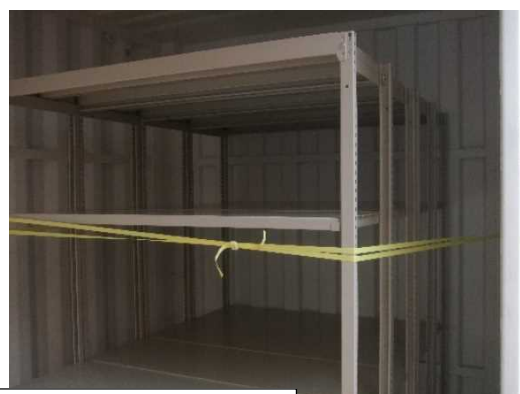
軽量棚（棚板4枚×4台）設置場所は別途指示