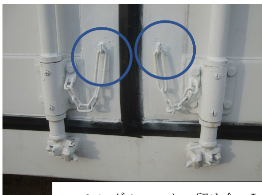
シングルロック・留め金・L型フック（各扉1か所）