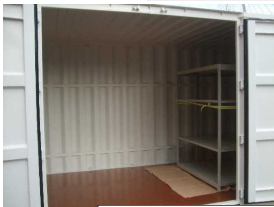
換気口（4か所） 長辺両角上部