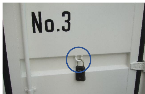
鍵ボックス用のU型フック (各扉1か所) 鍵ボックスは当課で準備