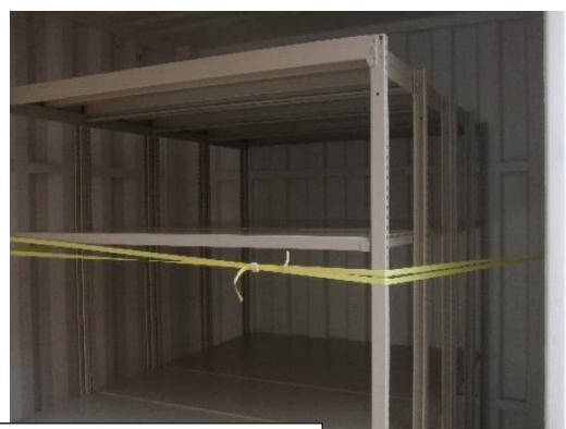
軽量棚 (棚板4枚×4台) 設置場所は別途指示