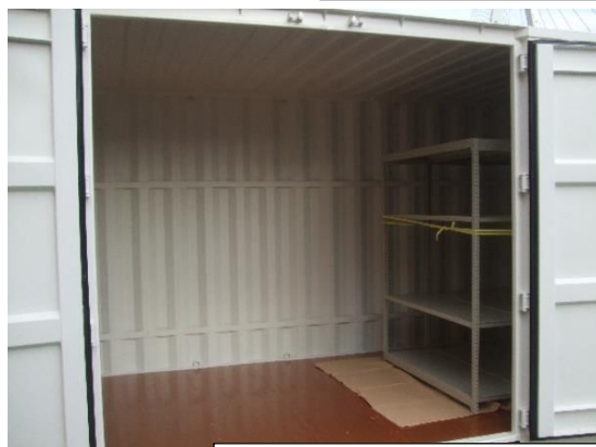
換気口 (4か所) 長辺両角上部