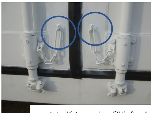
シングルロック・留め金・L型フック (各扉1か所)