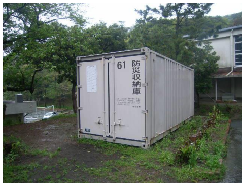
長さ 6000mm×幅 2400mm×高さ 2550mm