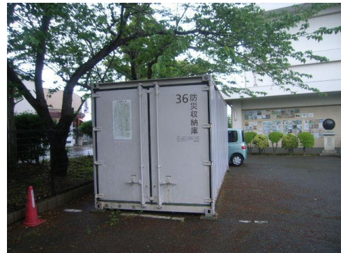
長さ 6000mm×幅 2400mm×高さ 2550mm