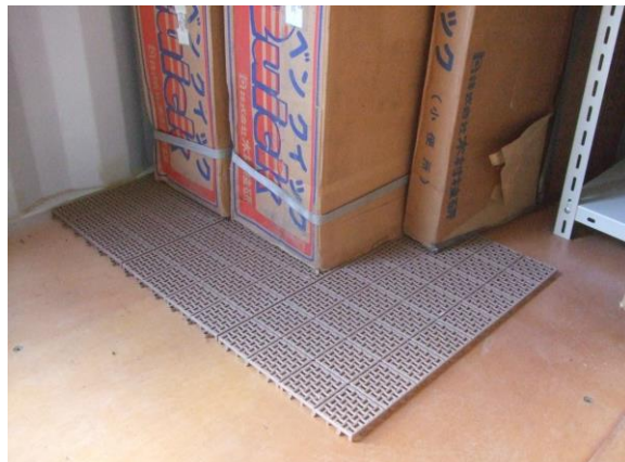
ジョイント式プラスチック製の このこ (30 cm×30 cm) 20枚