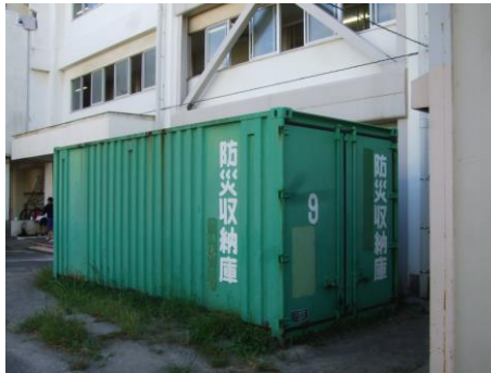
長さ 6000mm×幅 2400mm×高さ 2550mm