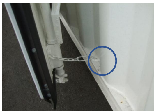
留め金用のL型フック (左右各1か所)