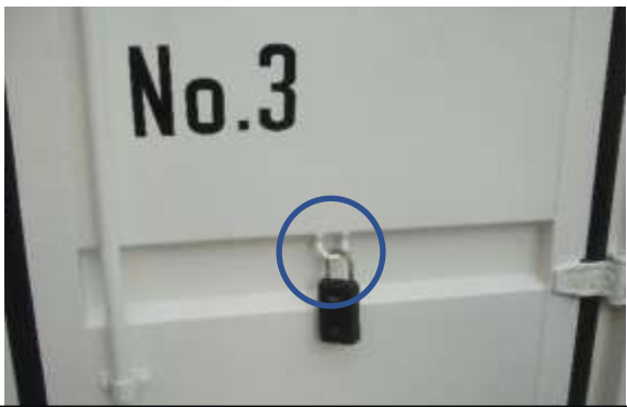
鍵ボックス用のU型フック (各扉 1 か所) 鍵ボックスは当課で準備