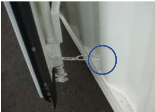
留め金用のL型フック (左右各 1 か所)