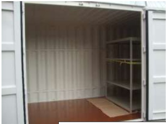
換気口 (4 か所) 長辺両角上部