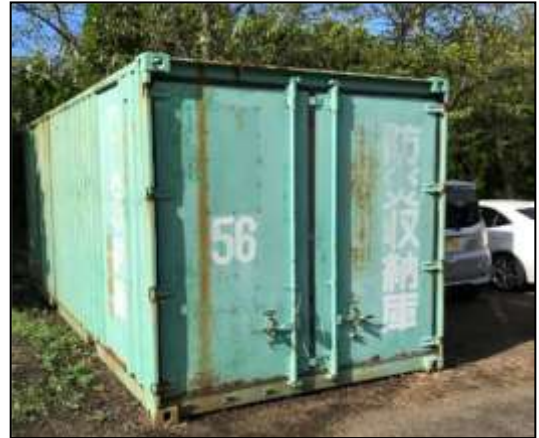
② 衣笠中学校・スチール製・No.56