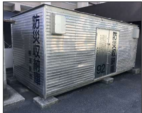
④ 栗田小学校・ステンレス製・No.92