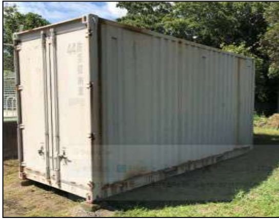
① 望洋小学校・スチール製・No.44