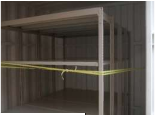
軽量棚 (棚板 4 枚×4 台) 設置場所は別途指示