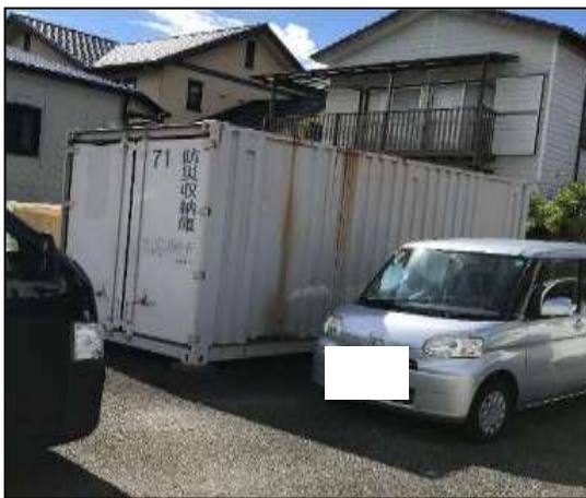
③ 野比小学校・スチール製・No.71