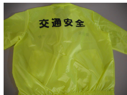
16~18 ジャンパー サイズ S, M, L