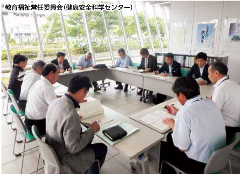
教育福祉常任委員会(健康安全科学センター)