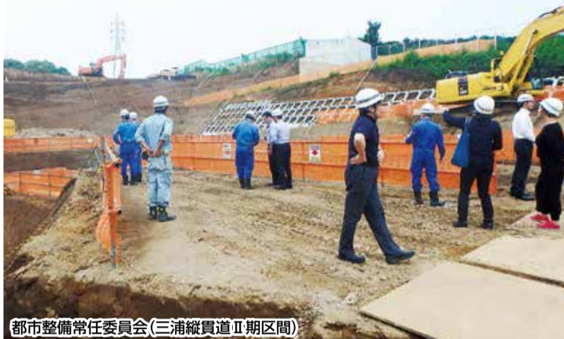
都市整備常任委員会(三浦縦貫道Ⅱ期区間)