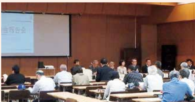
議員からの議会報告

「おもしろい取り組みなので次回は知人にも声をかけたい」「和やかな雰囲気たくさん意見を出すことができた」といったご感想もいただきました。引き続き、多くの市民の皆さんのご意見をいただける議会報告会にしていきたいと思ひます。