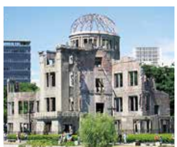
核兵器廃絶に向けたシンボルの原爆ドーム

たが、議案15件を全て可決しました。 請願6件については、2名の議員から賛成討論がありました。採決の結果、5件は賛成少数で不採択となりました。また、請願第5号は採択され、それに伴い提出された「教職員定数改善の推進及び教育予算の拡充を求める意見書」を全会一致で可決しました。 このほか、6月13日、15日には、各常任委員会で、市が所管する施設等へ足を運び、市の事業や現場の取り組みを調査しました。