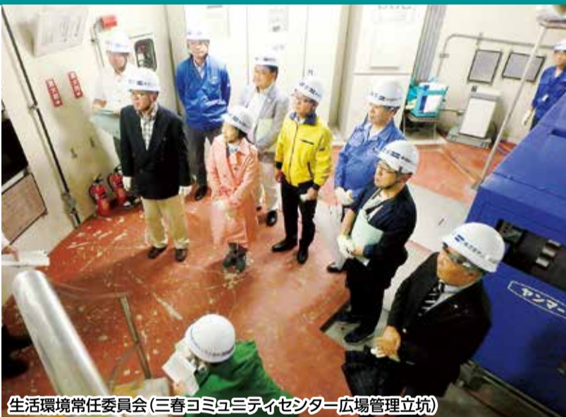
生活環境常任委員会(三春コミュニティセンター広場管理立坑)