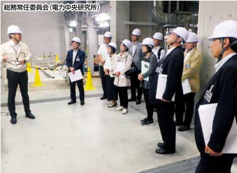
総務常任委員会(電力中央研究所)