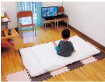
病児病後児保育センター