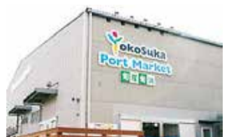
来年3月に閉店するポर्टマーケット

舗経営のノウハウがな いまま事業 をスタート し、抜本的 な改善もできずに経営 を継続した ことが最大の問題点」とした総括 を受け、多くの質問がありました。