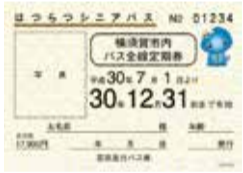
現在発売されているはつらつシニアパスの見本

委員からは、事業効果を検証する必要性、これまでの見直し協議の経過、バス事業者との協議における市の姿勢などについて、多くの質問や意見が出されました。