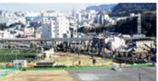
整備工事を行っている佐原2丁目公園野球場

矢部川に隣接する施工箇所のうち工法変更をしない理由や、川から距離がある箇所を工法変更